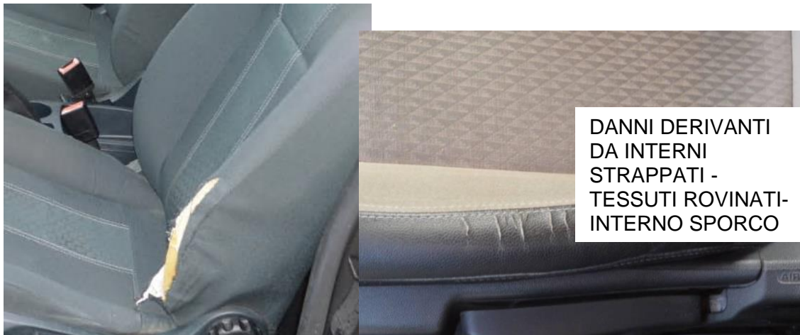
DANNI DERIVANTI DA INTERNI STRAPPATI - TESSUTI ROVINATI- INTERNO SPORCO