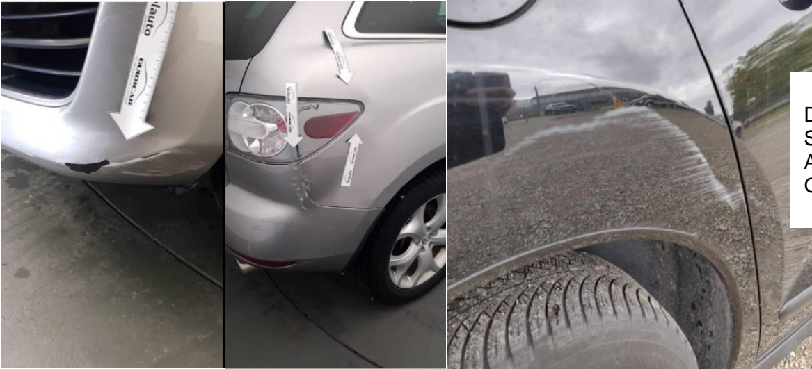
DANNI DA URTI- SCROSTATURE- AMMACCATURE- GRAFFI