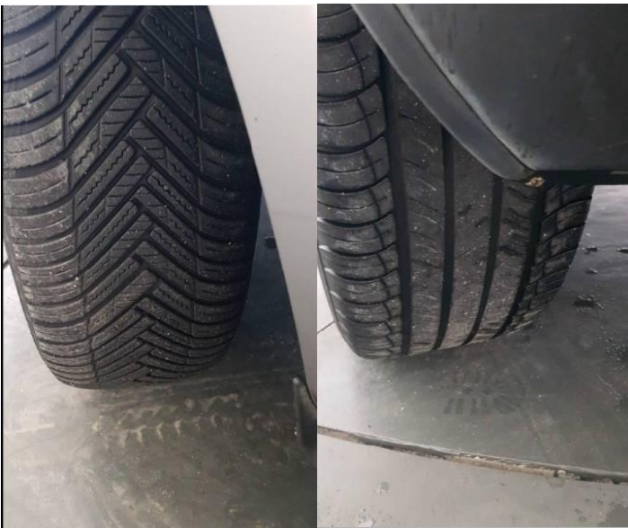
USURA DEI PNEUMATICI